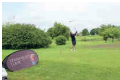
RICHTUNG FINALE: Am 16. & 17. September steigt das Tourfinale

nierkalender eintragen. Das nämlich ist der Termin des großen Tourfinales, das heuer im GC Swarco Amstetten-Ferschnitz über die Bühne geht. Mitten im Mostviertel geht es dann die jeweils 30 Besten in sechs Handicap-Gruppen um den Gesamtsieg und natürlich die heiß begehrten Finalreisen, die auf die SiegerInnen warten. Als „Final destination“ wird dieses Mal Mallorca angesteuert. Mehr über die Reisen finden Sie auf Seite 16.