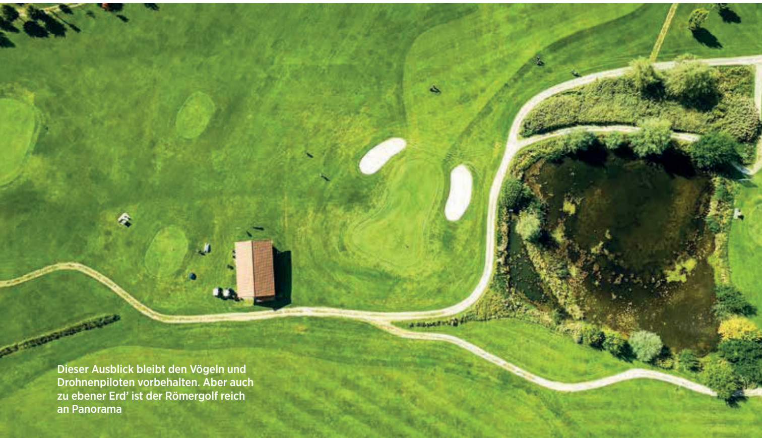
Dieser Ausblick bleibt den Vögeln und Drohnenpiloten vorbehalten. Aber auch zu ebener Erd' ist der Römergolf reich an Panorama