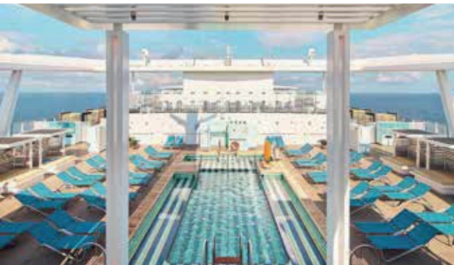
Auf der Golf & Cruise-Kreuzfahrt der Costa Smeralda verbindet man gekonnt klassischen Müßiggang mit der einen oder anderen Runde Golf. Unten: Der Ryder Cup Platz 2023 Marco Simone bei Rom steht auch am Speiseplan!