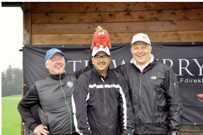
Spaß darf auch sein!