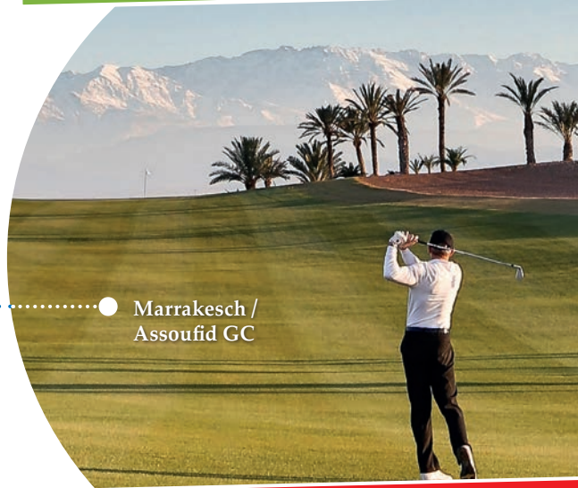
● Marrakesch / Assoufid GC

Detailprogramme & alle Packages finden Sie auf www.gruber-golfreisen.at