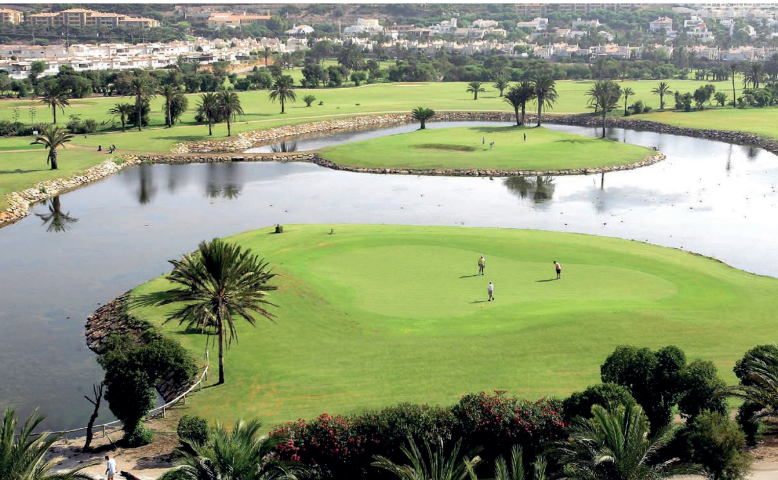
Die Golfanlage Almerimar