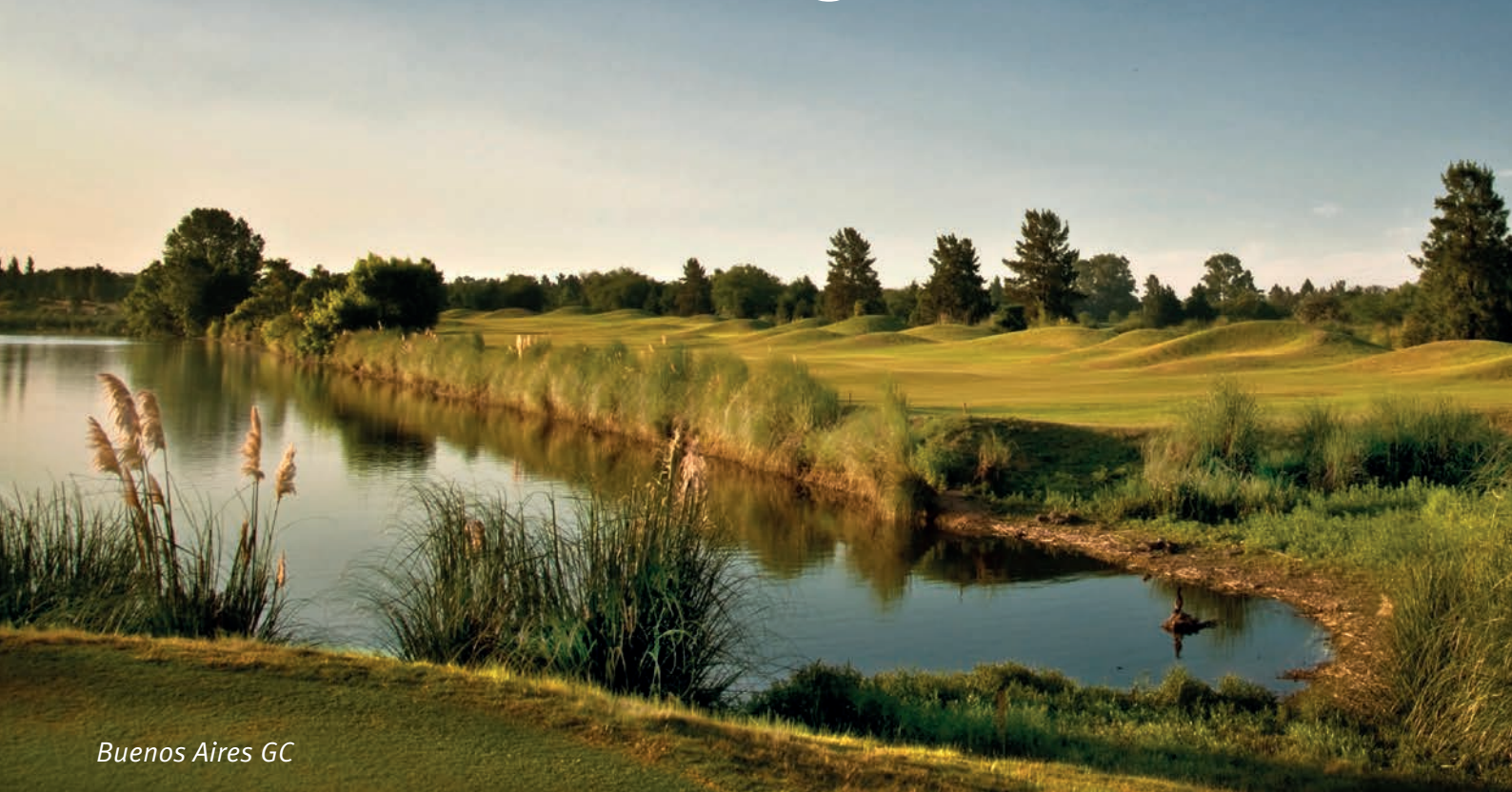
Buenos Aires GC

A benteuerlust, Neugierde und Sehnsucht nach Vielfalt haben mich dazu getrieben, rund um Buenos Aires und in Patagonien Golf zu spielen. Auch wenn die Golfplätze hier keinesfalls den Eindruck erwecken, hier würde man am Ende der Welt spielen, ist es für ÖsterreicherInnen doch ziemlich abgelegen. In Kombination mit Lifestyle, Sport, Kulinarik und Naturschauspielen aller Art ist Argentinien für Golf-AbenteurerInnen, HedonistInnen und LiebhaberInnen atemberaubender Kulisse aber genau der richtige Hot Spot.