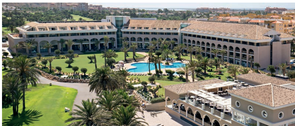
Das Golfresort Almerimar mit Swimming Pool

Auch äußerst interessant und ein absolutes „MUST“ ist der Besuch bei CLISOL, einem der tausenden Glashäuser mit anschließender Verkostung dort angebauten köstlichen Tomaten, Gurken und Paprika. Dieser Besuch öffnet auch die Augen, was die so wichtige Landwirtschaft in diesem Gebiet bedeutet und obendrein werden einige Vorurteile abgebaut. In dieser Gegend findet man also nicht nur einen Top-Golfurlaub, sondern auch Wissen und Kultur.