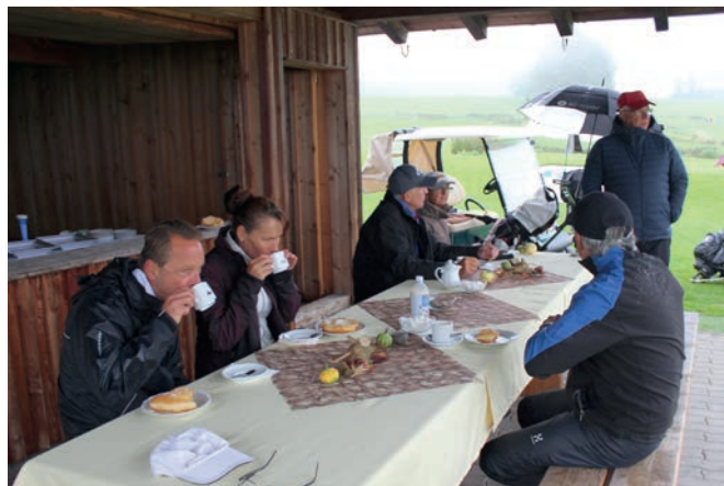
Gemütliche Stärkung im Halfway-Haus mit frisch zubereiteten Bauernkräften und Heissgetränken

Bereits seit längerer Zeit organisiert das Partner-Unternehmen „Golf4Life“ in Rosenheim (Bayern) die „Strawberry Tour Deutschland“, unterstützt vom deutschen Golfverband. Für Spieler bedeutet dies, dass sie grenzübergreifend günstig Turniere bei allen der rund 250 teilnehmenden Golfclubs spielen können. Von Nordsee bis Adria, vom Ruhrgebiet bis Budapest – die Strawberry Tour lässt den europäischen (Golf-) Gedanken hochleben wie kein anderer!