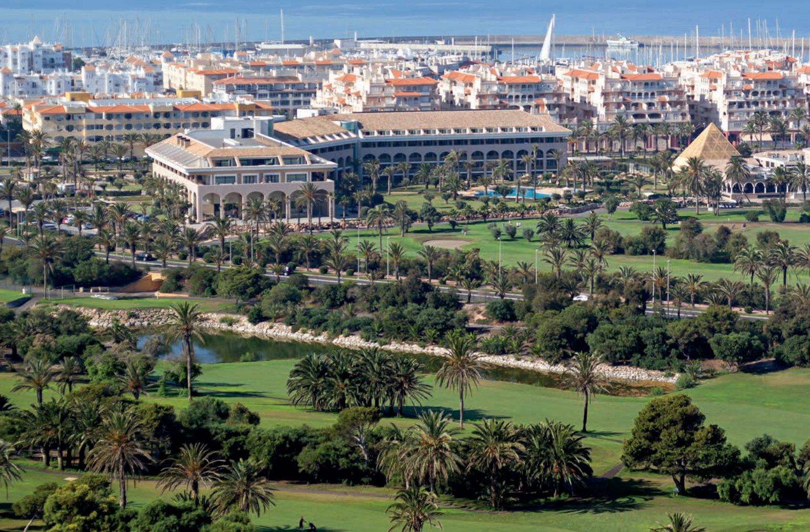
Blick von der Golfanlage „Almerimar“ Richtung Mittelmeer, vorne links das Hotel

Hotel verfügt über 120 top gestylte Designer Zimmer mit Armaturen von Giorgio Armani, eigenem Spa Bereich mit einem umfassenden Wellnessangebot, einer gut sortierten Hotelbar, einem großzügigem Restaurant und einem schönen Clubhaus. Im Hotel befindet sich auch das „Ikari“, ein á la carte Sushi-Restaurant auf Topniveau. Das gesamte Golfresort liegt nur 5 Minuten vom Hafen und vom Strand entfernt.