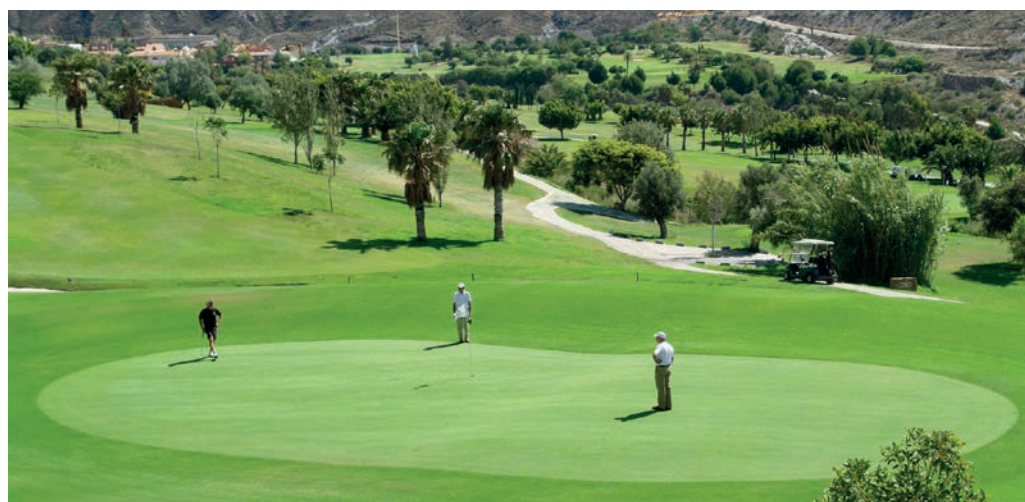
Die Golfanlage „La Envía“