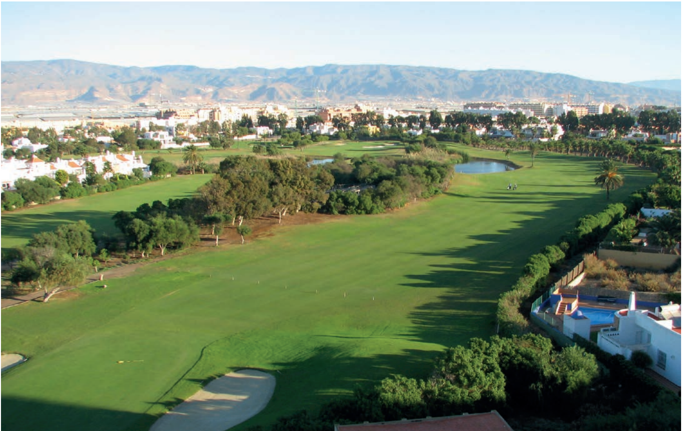
Golfplatz „Playa Serena“